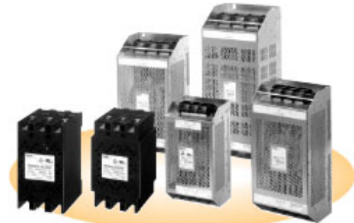
パワーフィルタ RNF形